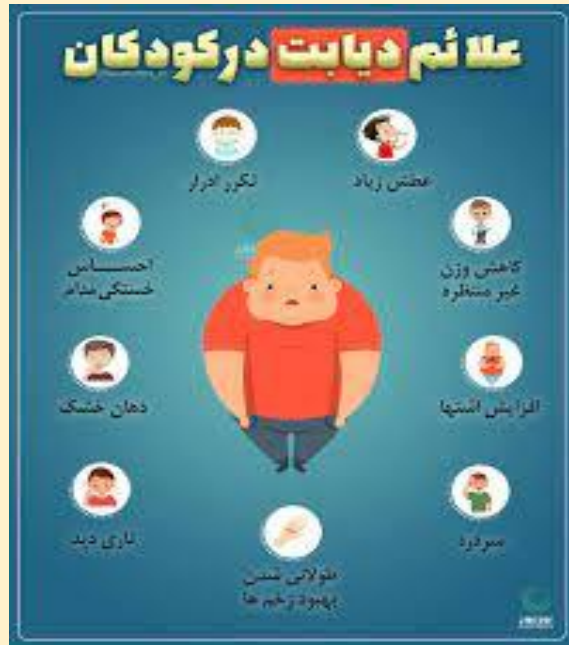
گروه هدف: بیمار و خانواده